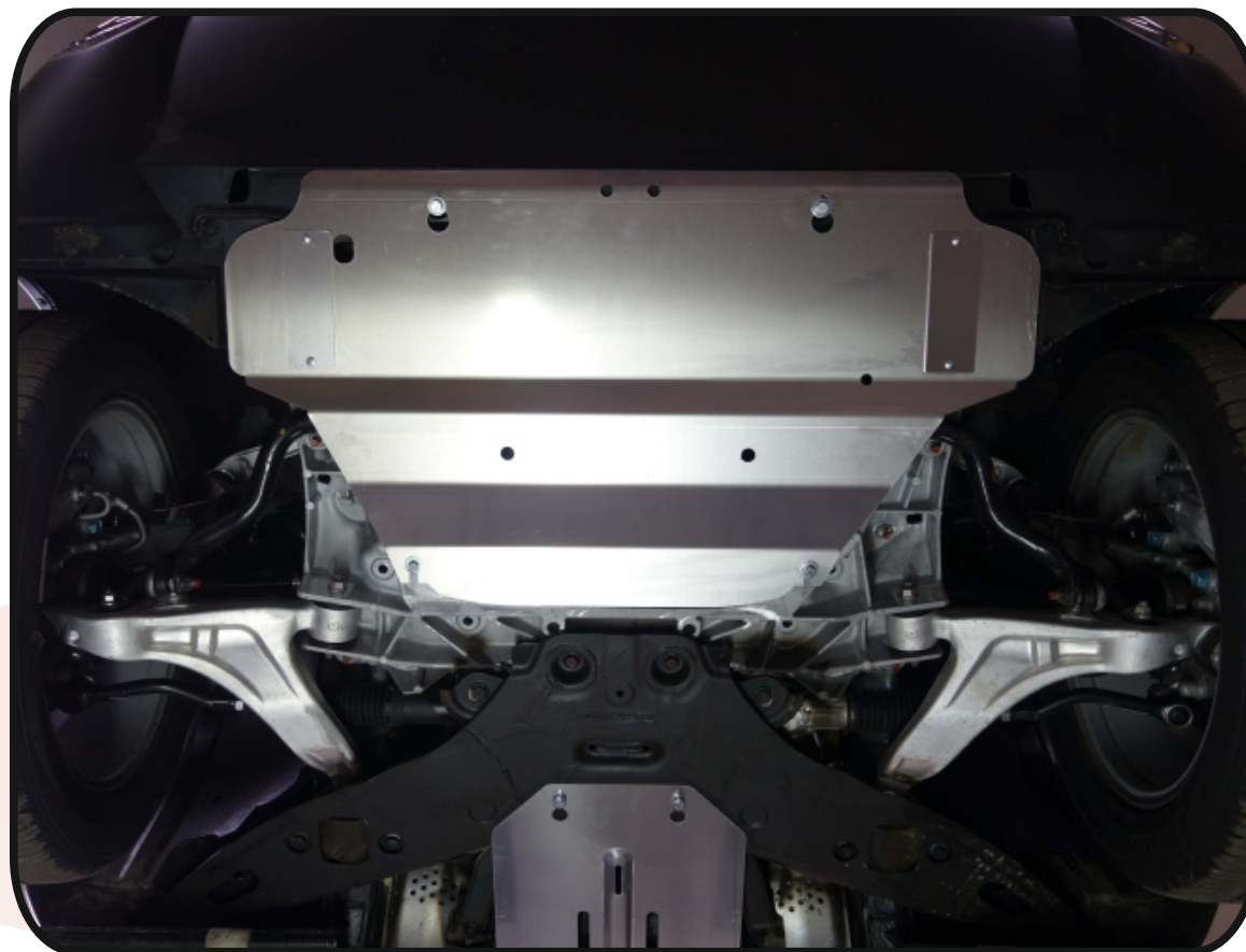
Защита картера (алюминий) 4 мм арт. ZKTCC00006