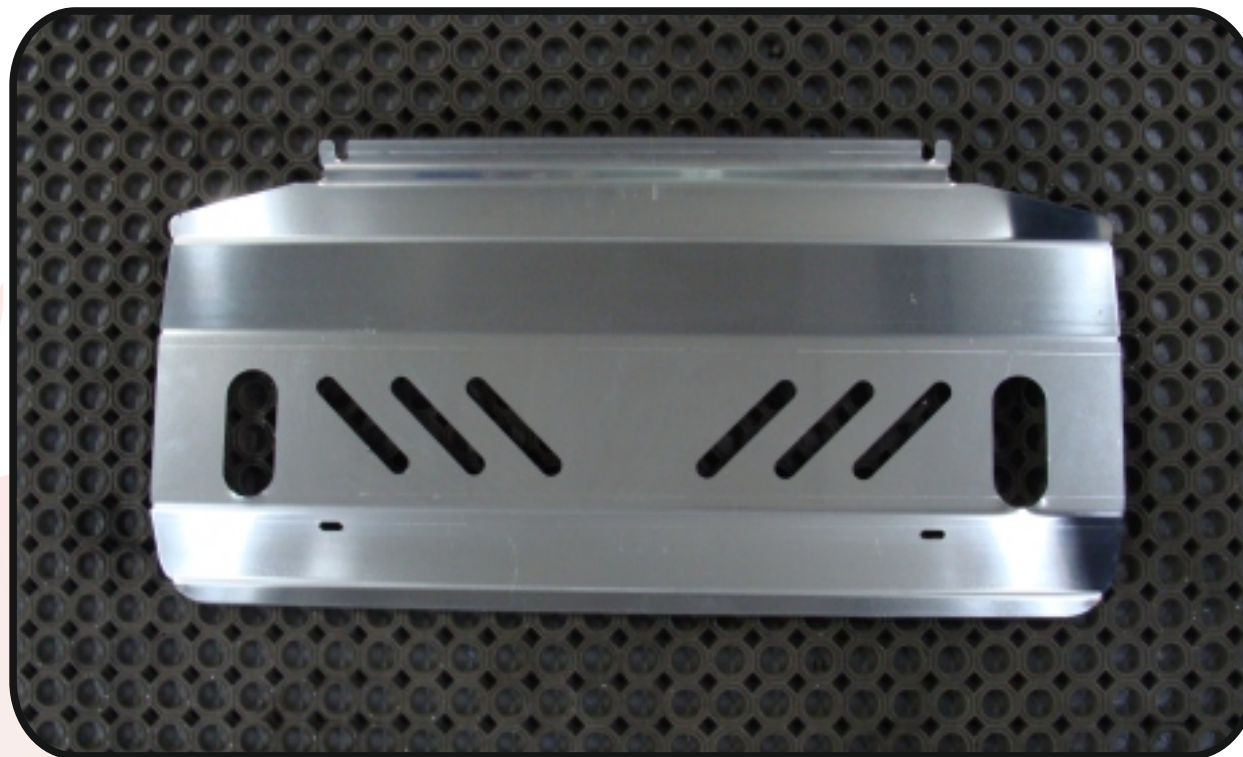
Защита радиатора (алюминий) 4 мм арт. ZKTCC00050